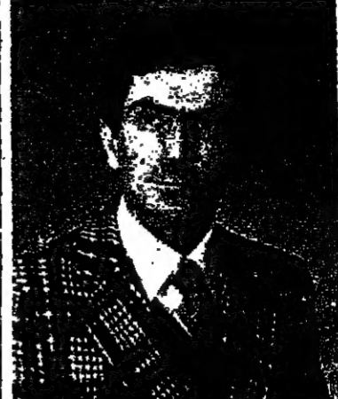
يمكننا القول بان مسرح اليوم هو مسرح تجريبي، اعتقدت في السبعينات...